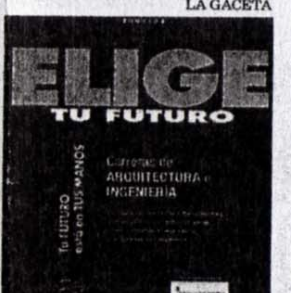
La formación profesional se recoge en la colección.

P.M. Todos los títulos oficiales de formación superior que se imparten en España están recogidos en la colección Elige tu Futuro , una práctica guía para dedicarse, con pleno conocimiento, por una profesión. La colección, que consta de cinco volúmenes, recoge tanto carreras universitarias como enseñanzas artísticas, formación profesional, estudios de artes plásticas y diseño, y la ca-